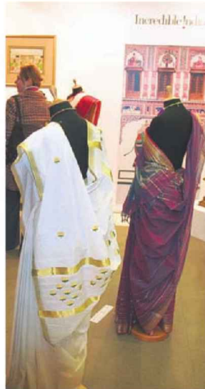
Најфиније изаткано платно раскошних боја дугачко је до осам метара