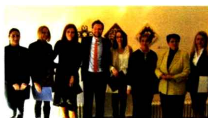
Nagrađeni dizajneri sa organizatorima konkursa

– Etno mreža želi da uključi mlade i inovativne dizajnere u očuvanje tradicije i poveže ih sa ženama koje izrađuju rukotvorine, kako bismo dobili