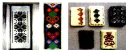
Radovi nagrađenih dizajnera