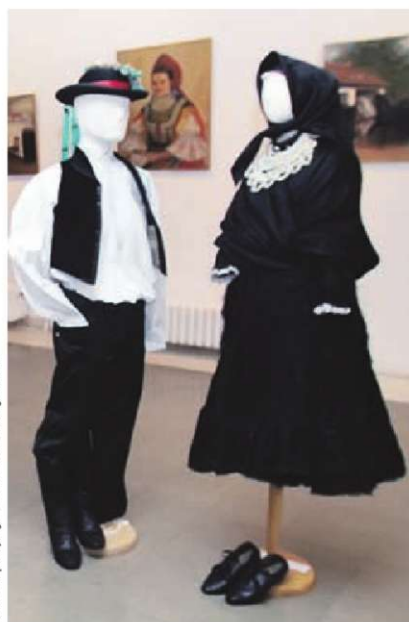
Изложба у Етнографском музеју

Поставка „Словачке народне ношње из Бачке” представљена је у Етнографском музеју и на занимљив начин сведочи о култури овог народа. На отварању изложбе наступио је женски оркестар „Арадачке мешкарке” у коме је шест времешних хармоникашица.