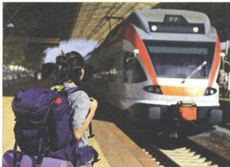
Olakšice... Putovanja ne moraju da budu skupa

U Beogradu, Novom Sadu i Nišu većina kulturnih institucija daje povoljniju cenu za akademce, a ide se jeftinije i na bazene, putovanja, kod lekara