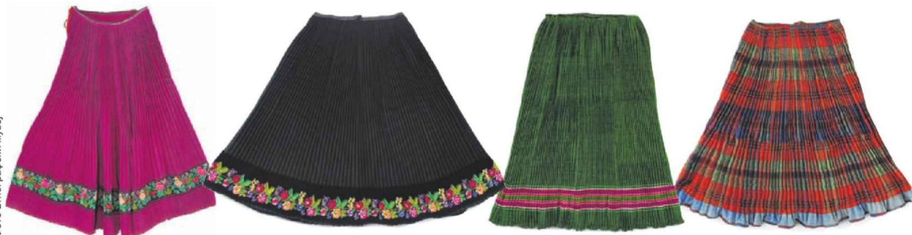
Сукња из околине Сопота