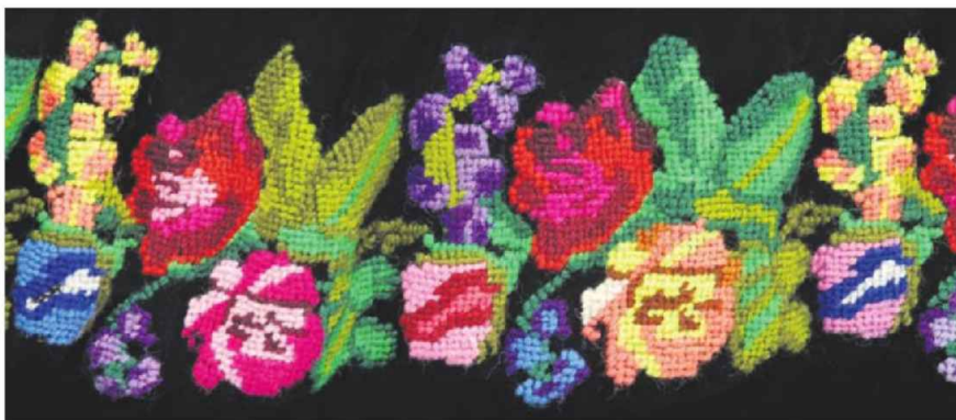
Детаљ веза са једне од шумадијских сукњи

Током постављања експоната, како је приметила ауторка изложбе, знатижељним погледима и спремношћу да помогну како затворенице тако и радници установе под ингеренцијом Министарства правде, показали су да их поставка занима.