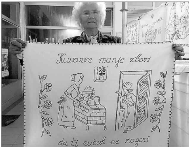
ЦРТЕЖИ "Куварице" са духовитим порукама

ЗА нишку гинисовку до сада нико до градских власти није имао разумевања нити је добила неко признање. Први помак направило је предузеће "Тржница", које јој је уступило простор на Сајмишту.