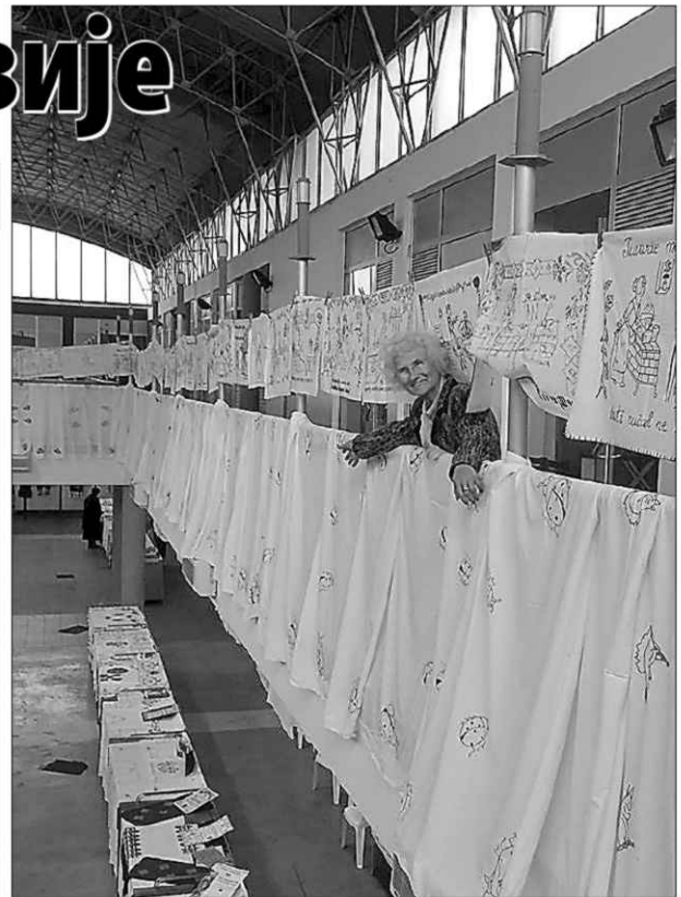
РУКЕ Столњак дуг чак 108 метара у Гинисовој књизи рекорда

- Желела сам да урадим нешто по чему ће ме свет памтити - искрена је Слобо-