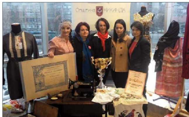
Модернизовале старе рукотворине: представнице радионице на Сајму

У кројачкој радионици Центра, основаној ове године, два пута седмично у поподневним сатима учи и ствара око 30 жена. Њих обу-