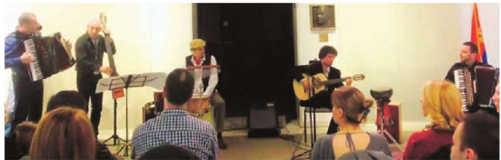
Састав „Етно фјуел” у Етнографском музеју

– Састав „Етно фјуел” би могао бити озбиљан кандидат