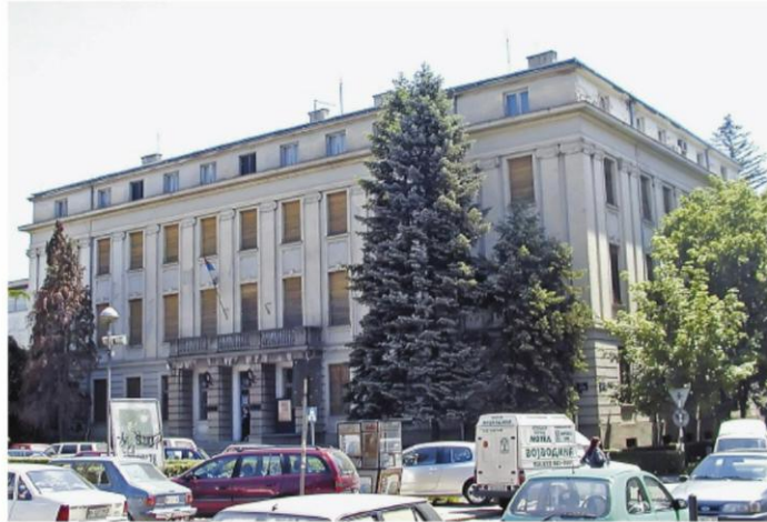
Галерија Матице српске излаже уметничку колекцију компаније Таркет