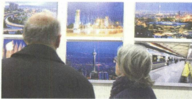
Изложба иранских фотографија, илустрација и рукотворина