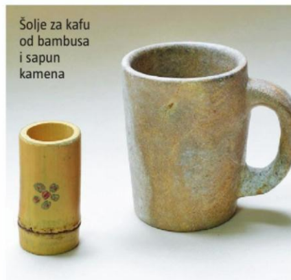
Šolje za kafu od bambusa i sapun kamena