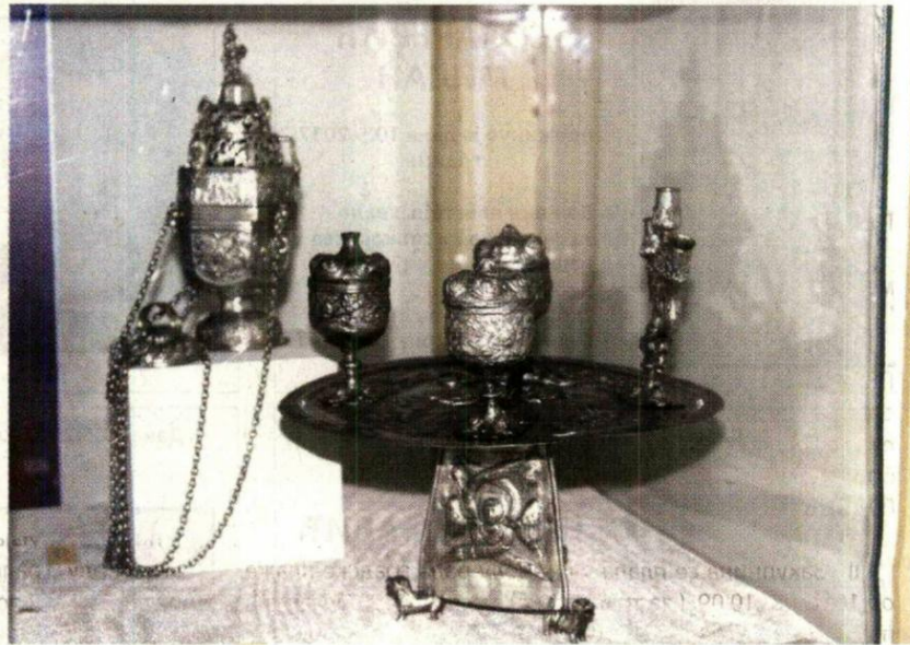
Детаљ са изложбе