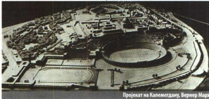
Пројекат на Калемегдану, Вернер Марх