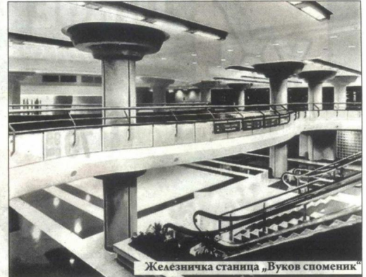
Железничка станица „Вуков споменик“