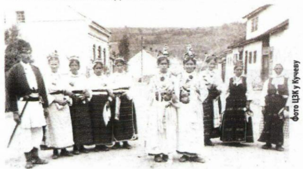
ФОТО-ИСТОРИЈА ЗВИЖДА И ХОМОЉА