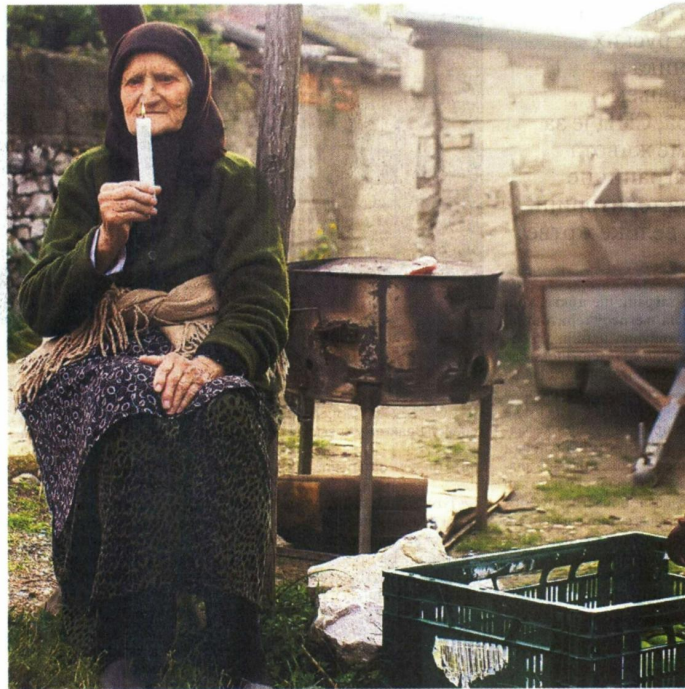
Једна од фотографија са изложбе „Просветли таму”