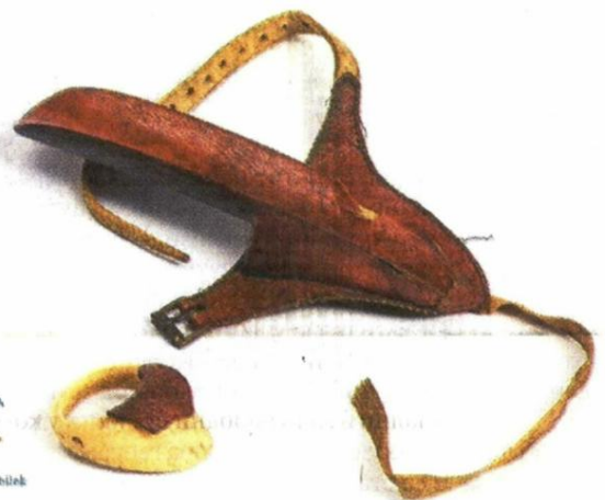
Модели зглобних штита без табле, средина 17. века Исторички А. Селџучки Истанбул