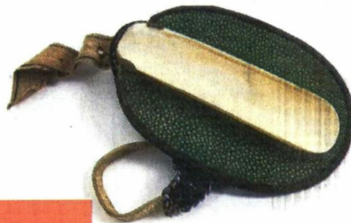
Османски зглобни штит Национални музеј Истанбул Османли белек ширви Белек Ширви Национални музеј