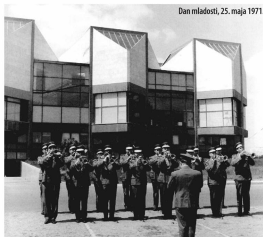
Dan mladosti, 25. maja 1971.

Za dalji razvoj MSU važnu stavku ima i to što je on uvršten u protokol Savezne vlade. To je ovu instituciju učinilo redovnom stanicom pri obilasku znamenitosti glavnog grada stranih državnika (ili njihovih supruga), krunisanih glava, političara, kulturnih poslenika. Nikolae Čaušesku, Kenet Kaunda, Luis Ečeverija, britanska princeza Margareta, belgijska kraljica Fabiola, holandska kraljica Julijana,