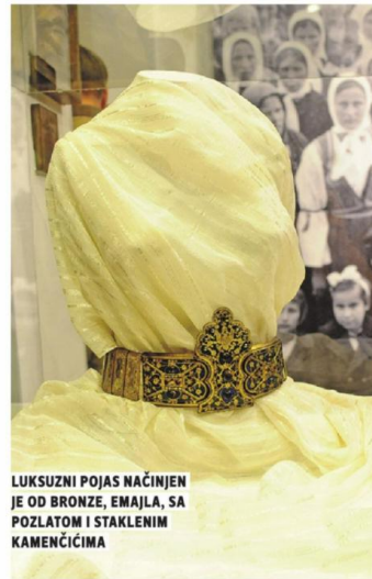
LUKSUZNI POJAS NAČINJEN JE OD BRONZE, EMAJLA, SA POZLATOM I STAKLENIM KAMENČICIMA

- Postavka "To smo mi - Narodna zanimanja u Srbiji" biće u Muzeju u naredna tri meseca. Gosti iz Etnografskog muzeja iz Zagreba upravo su tu sa postavkom "Ljudi i životinje", a uskoro počinje međunarodni festival etnološkog filma i tom prilikom će biti prikazana 42 filma iz 18 zemalja - ističe direktorka Muzeja Tijana Čolak.