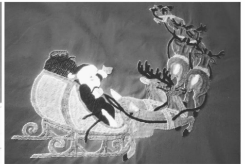
Новогодишњи мотиви на везу