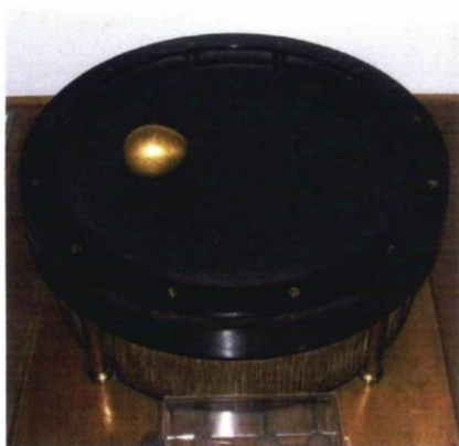
Muzej Nikole Tesle: Indukcioni motor - Teslino Kolumbovo jaje.