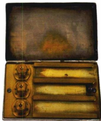
Muzej Nauke i tehnike: Šifarnik Mihaila Petrovića Alasa, konstruisan 1917. za potrebe srpske vojske.