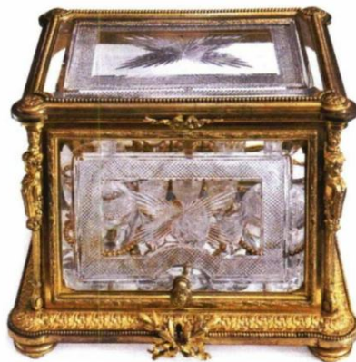
Dom Jevrema Grujića: Škrinja za liker, pozlaćena bronza i kristal, 1878.

na teritoriji današnje Srbije i Beograda, o našim sugrađanima, vremenima i prilikama. Davne 1844. godine, ukazom tadašnjeg ministra prosvete Jovana Sterije Popovića, postavljeni su temelji prikupljanja, čuvanja i prikazivanja muzejske građe kojom se ilustruje istorija srpskog i drugih naroda. National Geographic Srbija vas poziva u obilazak beogradskih muzeja, pri čemu ćete se upoznati s eksponatima koje smo istakli.