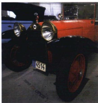
Muzej automobila: Lancia Lambda, model Lungo, 1926.