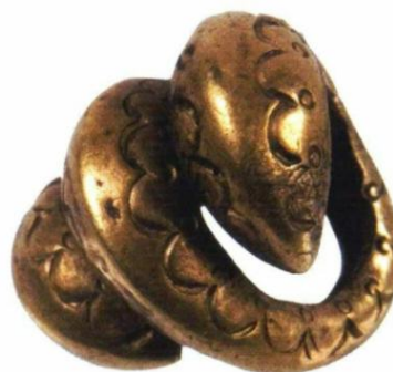
Narodni muzej, zbirka bronzanog doba: Zlatna prstenasta ukosnica u obliku zmiје, druga polovina drugo milenijuma P. N. E.

Tokom februara pratite serijal o beogradskim muzejima i vrednim eksponatima na našoj stranici www.nationalgeographic.rs .