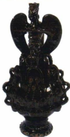
Etnografski muzej: Krčag, Knjaževac oko 1870.