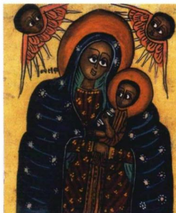
Muzej afričke umetnosti: Bogorodica sa Hristom, Etiopija.